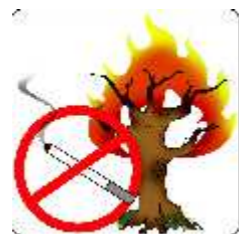
Interdiction de fumer No smoking

Appel d'urgence : Pompiers : 18 ou 112, Police nationale : 17