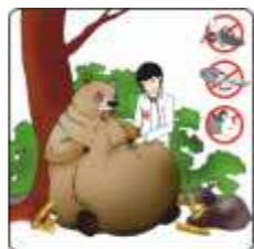
Interdiction de nourrir les animaux Do not feed the animals